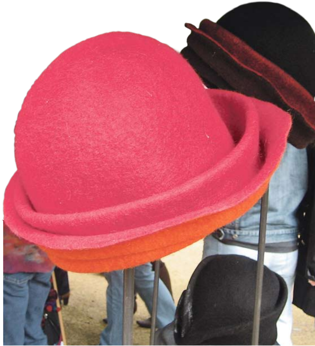
Warmes für den Kopf: Hüte und andere Kopfbedeckungen aus Filz gibt es in der Weihnachtsausstellung zu sehen.

In der Weihnachtsausstellung der Arbeitsgruppe Kunsthandwerk Braunschweig gibt es wieder viele schöne Dinge zu sehen und zu kaufen.